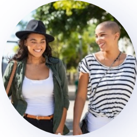
faire une balade

Posez des questions à vos camarades. Ils et elles répondent .