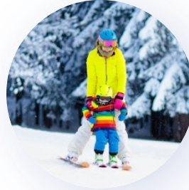
faire du ski