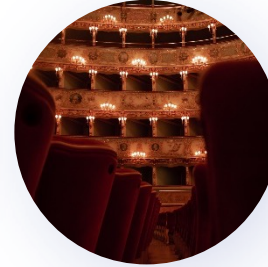
aller à l'opéra