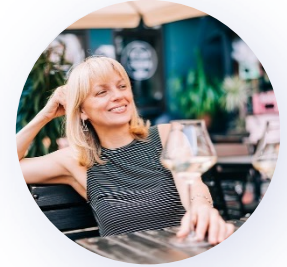
boire un verre